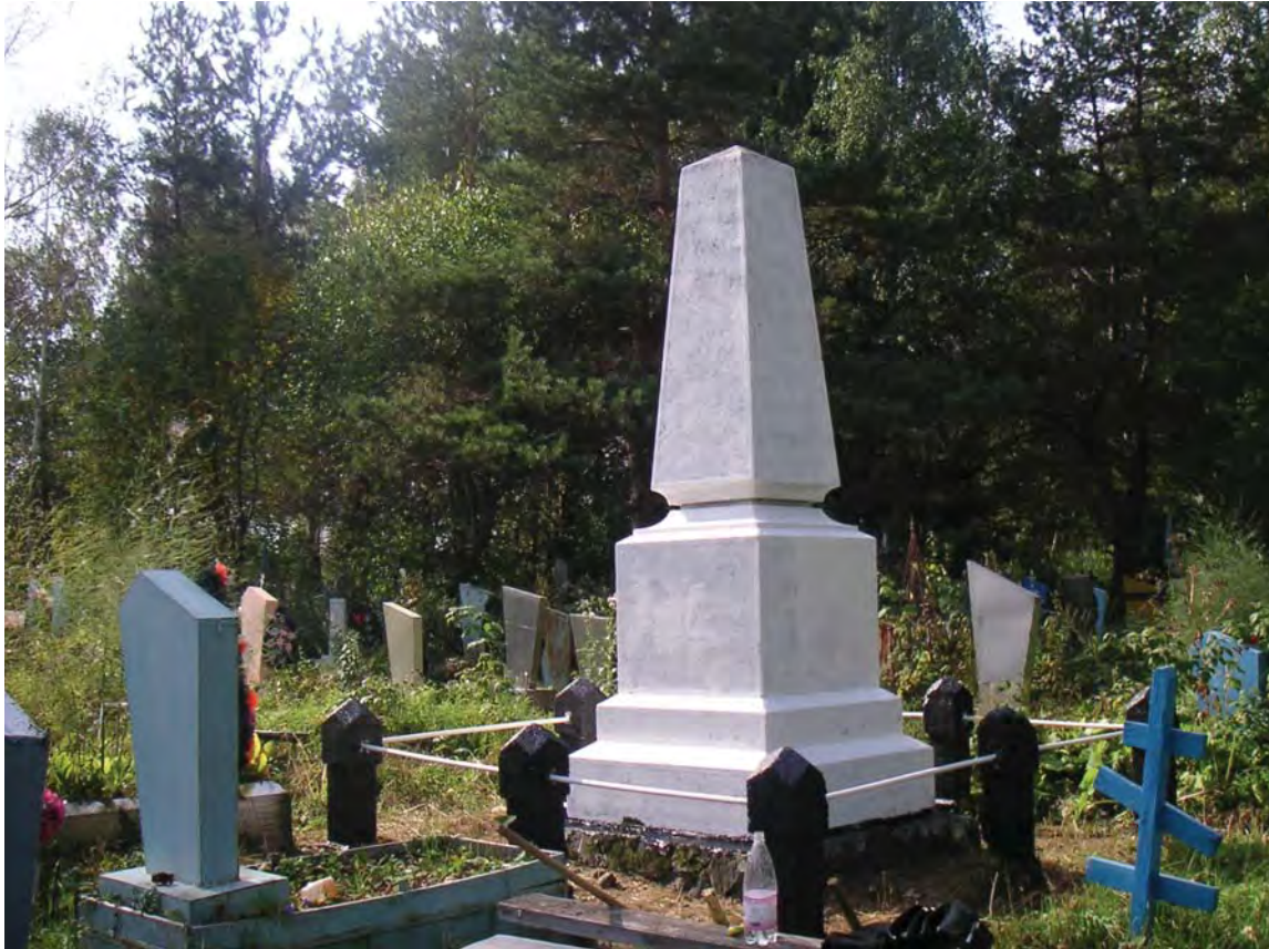
г. Нижняя Салда