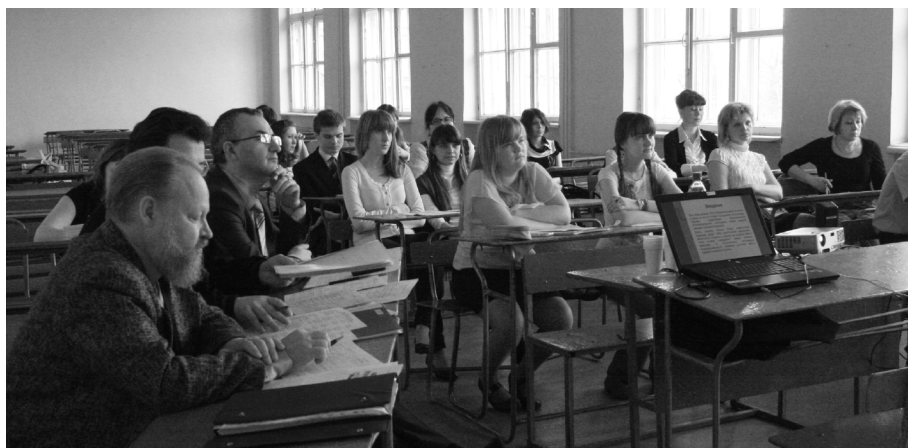
Сегодня в СТИ идут активные процессы возрождения научных школ, создаются интересные направления, проводятся уникальные исследования

— Я пользуюсь им уже года три, а то и все четыре, ни разу внутри не мыл!