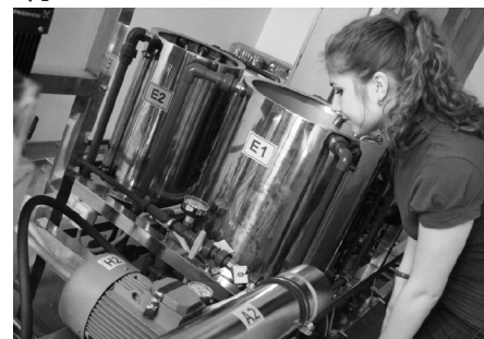
Не так давно благодаря проекту TEMPUS NETWATER в строительном институте появились новые мембранные установки