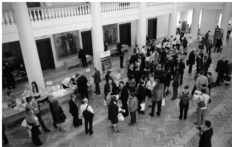
Традиционная «вшэмовская» экономическая конференция — одно из ярких событий и для вуза, и для региона в целом. На фото: идет регистрация на конференцию 2011 года, тогда она впервые была проведена в Актовом зале УрФУ по адресу Мира, 19. После объединения вузов стало больше вместительных площадок.