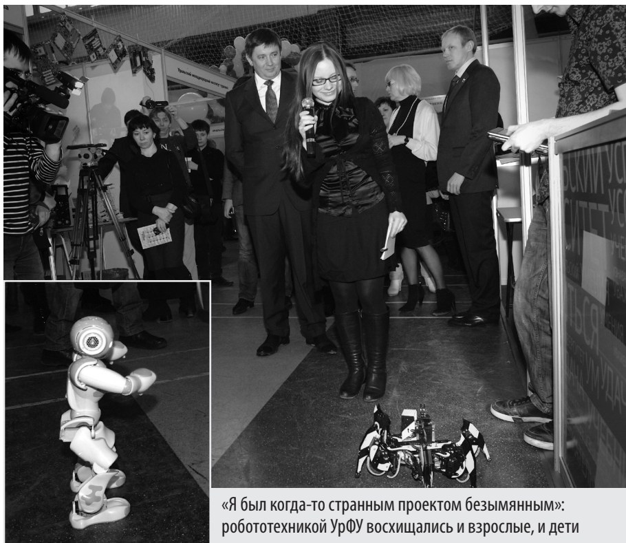
«Я был когда-то странным проектом безымянным»: робототехникой УрФУ восхищались и взрослые, и дети