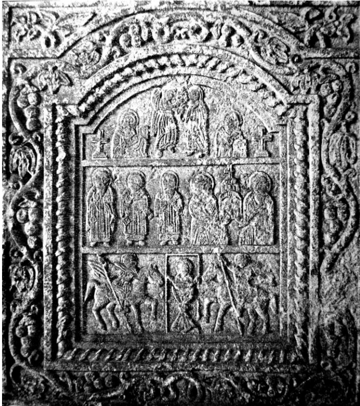
Рис. 1. Каменная икона из «Нового Карантина» (по: Кондаков Н. П., 1896, С. 35, Рис. 8)

рехлепестковые лилии, заполнены также верхние углы плиты. Центральное поле обрамлено четырьмя рядами рельефных багетов и полочек, расположенных уступами. Одна из них вырезана в виде «перевитого шнура».