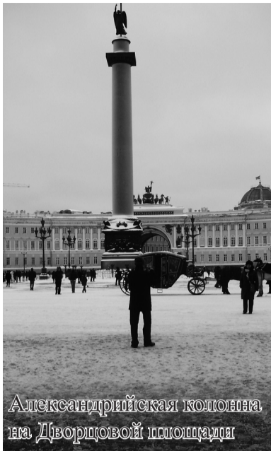
Александровская колонна на Дворцовой площади

«закулисьях» города картина уже совсем другая – в хлам убитые дома (местная особенность наводить марафет только с внешней стороны). Да и не радует это дыхание современной цивилизации прямо в центре города (ох уж эти дурацкие новостройки!). Была крайне удивлена отсутствием мусора в городе. Нет, он, конечно, есть, но попадает на глаза реже, чем наш повсюду «летающий ужас». То ли люди здесь культурнее, то ли законы жестче. Кстати, народ здесь живет также особый. Молодежь вся примарафечена. Особенно парни. Стиль продуман от головы до пят. Язык также своеобразный. Привычка всех питерцев – растягивать слова и в особенности букву «О». Слишком непривычно для уральского уха. Нас тянуло, что называется на «ха-ха». А потом не заметили, как к нам прилипло это самое «Ну воо-ооо-ооообщее...».