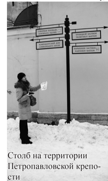
Столб на территории Петропавловской крепости

Там чувствуешь себя уютно и комфортно, как у себя дома. Сразу после схода на перрон Ладожского вокзала меня охватило приятное чувство спокойствия и романтики... Казалось бы, мы в чужом городе, толком не знаем куда идти, куда ехать. Хотя, с нынешними интернет-технологиями найти дорогу гораздо проще. Пока шли до метро, вертела головой по сторонам, восхищаясь зданием вокзала. Несомненно, он намного больше Свердловского, и как-то всё лучше продумано, что ли. Не мерзнешь на улице в поисках подземки, а преспокойно идешь себе по вокзалу, толпа сама тебя туда вынесет. Но куда уж мне да без приключений!