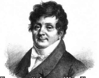
Тот самый Фурье, Жан-Баттиста Жозеф