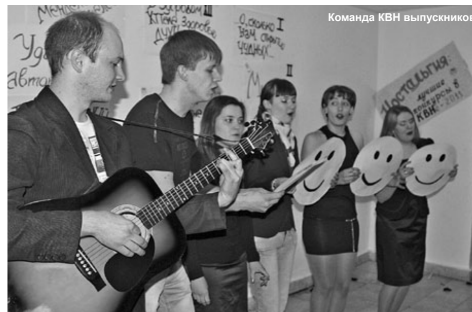
Команда КВН выпускников