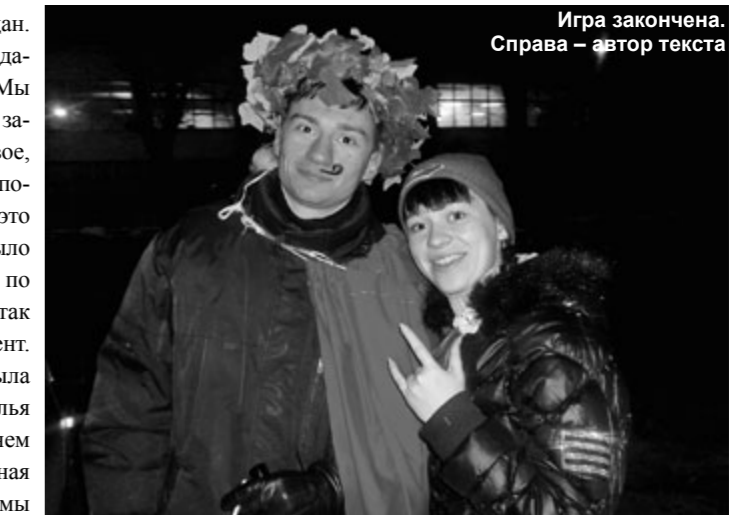
Игра закончена. Справа – автор текста