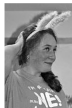
* * *

Для того, чтобы попасть на ХТТ, мне пришлось перебороть множество препятствий. Отважиться на первый в жизни перелет, например.