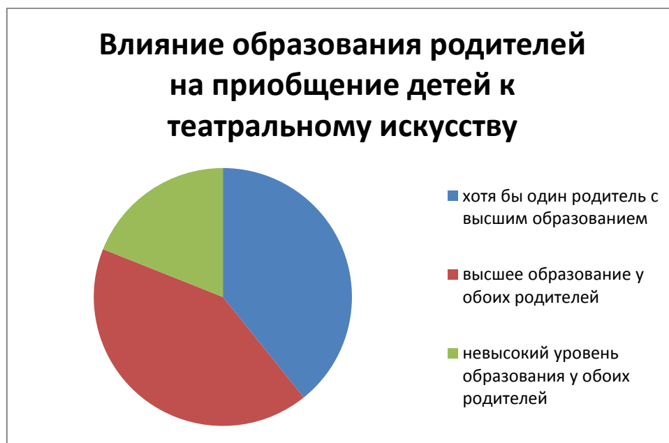
Рисунок 3. Влияние образования родителей на приобщение детей к театральному искусству

Исследование зафиксировало интересный факт, что образования родителей заметно сказывается на интересе ребят к искусству театра, поэтому совместное посещение театра имеет большое значение для развития у ребёнка интереса к театральному искусству. В семьях, где кто-то из родителей имеет высшее образование и регулярно посещают театр вместе с детьми, школьники обнаруживают интерес к искусству театра не многим меньший, их было всего 30% участвующих в исследовании ребят, чем их сверстники, родители которых имеют оба высшее образование, таких было 32% респондентов. К сожалению, далеко не все папы и мамы понимают, как важно создать дома благоприятный климат вокруг интереса ребенка к театральному искусству. Вообще стараются, не проявлять интереса к театру учащиеся, где в семье оба родителя имеют, невысокий уровень образования, таких было 14,5% респондентов, среди данной категории респондентов всего 2% посещали театр со своим ребёнком хотя бы один раз в год (см. рисунок №3).