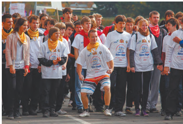
Студенты УрФУ на старте дистанции 2014 метров.