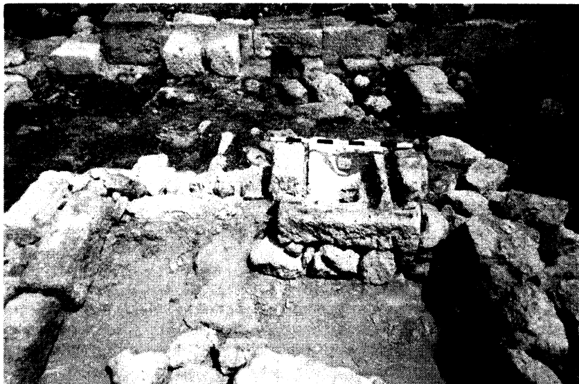
Рис. 4. Баптистерий базилики в «цитадели», первая половина X в. Фото 2004 г.