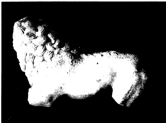
Рис. 3. Мраморная скульптура льва из «цитадели». Раскопки 1905 г.