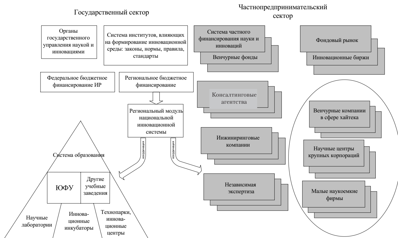
Рис. 5. Проект региональной инновационной системы Ростовской области