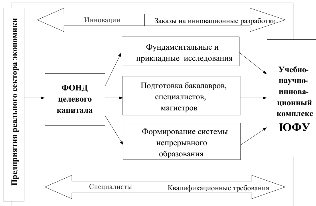
Рис. 3. Система взаимодействия бизнес-сообщества и ЮФУ