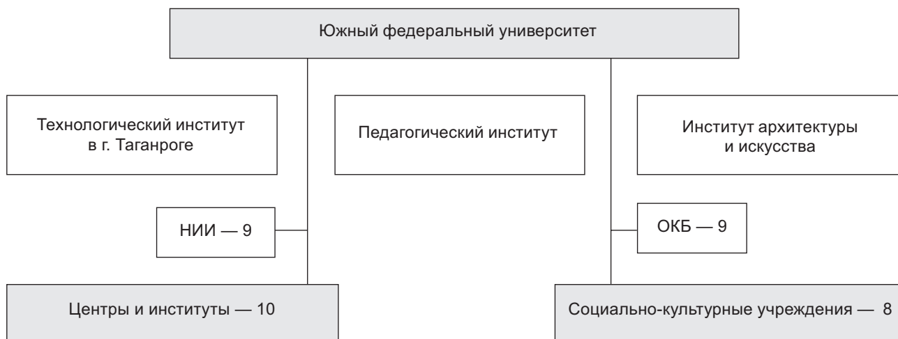
Рис. 1. Организационная структура Южного федерального университета

Модель взаимодействия бизнес-сообщества и ЮФУ выражается в формировании фонда целевого капитала, который, в соответствии с принятым Федеральным законом, становится важным звеном, обеспечивающим механизм взаимодействия (рис. 2).