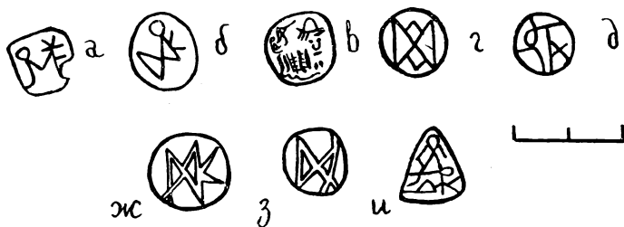
Рис. 2. Клейма на амфорисках второй группы

в 1911 г. «круглой ямы» помещения В северо-восточного района херсонесского городища 7 . Материал, содержащийся в яме, датируется V—VI вв. и представлен фрагментами амфор с коническим корпусом 8 , амфор сиро-палестинского типа 9 , круглодонной амфоры вытянутой формы типа 99 по И. Б. Зеест 10 , ножками стеклянных рюмкообразных сосудов 11 . Точное время образования комплекса определяют многочисленные фрагменты краснолаковых блюд группы «Поздний Римский С», формы 3, типа F, датирующиеся второй четвертью VI в. 12