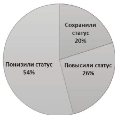
Рис. 2. Динамика эволюции ПГТ на Среднем Урале (1920-е — нач. 2000-х гг.).

ным, если принять во внимание, что в этот период городскими поселками часто становились бывшие заводы, приобретшие за долгий срок своего существования городские функции.