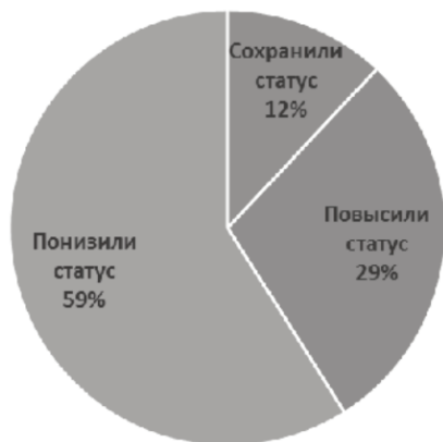
Рис. 4. Эволюция ПГТ, возникших в 1930-е гг.

Совершенно иначе выглядит картина для поселков городского типа, появившихся в годы первых пятилеток (59 % неуспешных ПГТ, рис. 4) и особенно в годы Великой Отечественной войны (80 % неуспешных ПГТ, рис. 5).