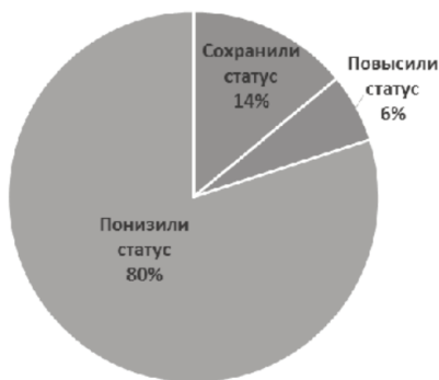
Рис. 5. Эволюция ПГТ, возникших в 1940-е гг.

Именно в эти периоды в наибольшей степени были востребованы сырьевые ресурсы региона. Поселения, возникавшие вблизи рудников, либо перерабатывающих предприятий после истощения месторождения фактически обрекались на медленное умирание. Эта же тенденция наблюдалась и в 1950-е гг. (67 % ПГТ, понизивших свой статус), но зато 1960-е гг. демонстрируют качественно иную картину (рис. 6).