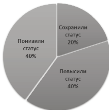
Рис. 3. Эволюция ПГТ, возникших в 1920-е гг.