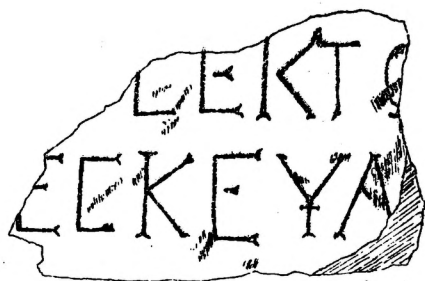
Рис. 1. Надпись с участка И. А. Антоновой