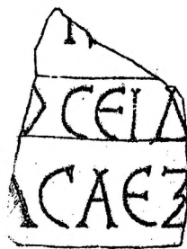
Рис. 2. Надпись с участ Л. Г. Моленниковой