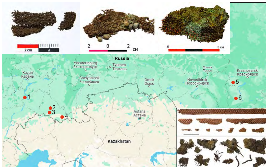
Рис.1. Расположение исследованных местонахождений: 1 – Золотая нива II (Самарская обл.), 2 – Каменка (Оренбургская обл.), 3 – Герасимовский III (Оренбургская обл.), 4 – Богдановка (Оренбургская обл.), 5 – Ужур (Красноярский край), 6 – Уйбат (Республика Хакасия)

Измерения проводили с использованием хромато-масс-спектрометра Clarus 600T (Perkin Elmer, США). В масс-спектрометре использовалась ионизация электронным ударом с энергией электронов 70 эВ. В газовом хроматографе использовалась капиллярная колонка Elite 5MS 30 м с внутренним диаметром 0.25 мм и толщиной неподвижной фазы (5% дифенил - 95% диметилполисилаксан) 0.25 мкм, лайнер с внутренним диаметром 4 мм. Пробу объемом 1 мм 3 вводили при помощи шприца вместимостью 10 мм 3 . В качестве подвижной фазы выступал гелий. Скорость движения подвижной фазы составила 1 см 3 /мин. Регистрацию спектров производили при помощи программного обеспечения TurboMass 2.0.