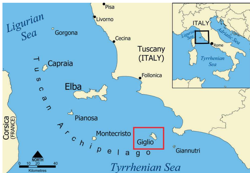
Ил. 2. Остров Игилий. Карта Нормана Эйнштейна (по: https://en.wikipedia.org/wiki/Isola_del_Giglio#/media/File: Tuscan_archipelago.png )

Рим и его жители во время разграбления города вестготами в 410 г.