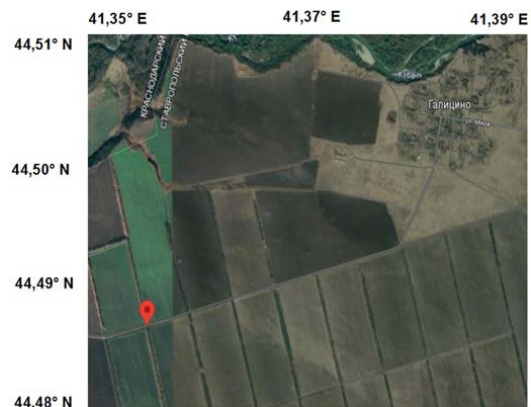
Рис. 1. Картограмма расположения точки отбора проб почв при изучении деградации и распределения 2,4-Д и 2,4-ДХФ по почвенному профилю (сервис Яндекс-карты, красным маркером показана точка отбора)

Внесение препарата «Балерина» (этилгексилэфир 2,4-Д) проводили 16 апреля 2022 г., а отбор проб – 18, 21, 25 апреля, а также 2, 16 и 26 мая 2022 г. Метеорологические характеристики за текущий период приняты по данным близлежащей метеостанции Невинномысск (табл. 1) [18]. Пестицид «Балерина» быстро деградирует в почвах и воде до 2,4-Д (период полураспада в почве – менее 24 ч, в воде – менее 1 ч) [4]. С учетом того, что его