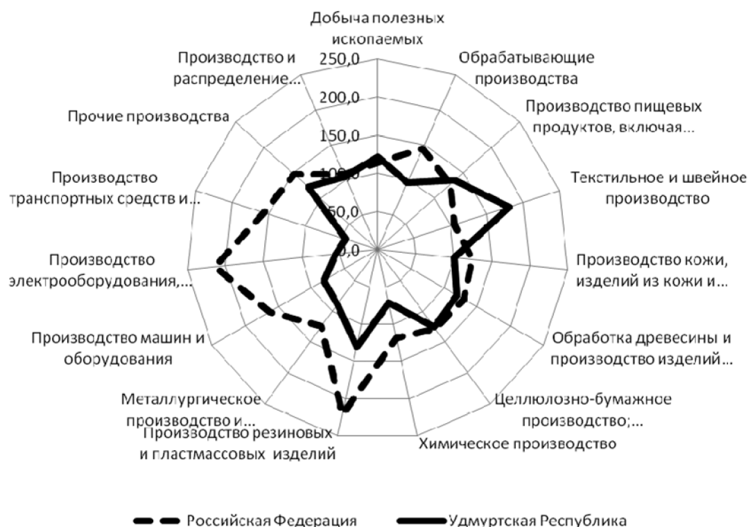
Рис. 1. Индексы промышленного производства в Российской Федерации и в Удмуртской Республике в период 2004–2008 гг., нарастающим итогом, %

Сравнение результатов промышленного развития по основным видам экономической деятельности Российской Федерации и в Удмуртской Республике показывает, что в предкризисный период и в начальный период кризиса наблюдалась определенная рассинхронизация в развитии базовых видов обрабатывающих производств (рис. 1). Особенно