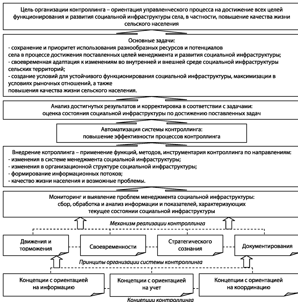
Рис. 2. Механизм контроллинга менеджмента организации и развития социальной инфраструктуры сельских территорий

Высокая динамика основных макроэкономических показателей, темпы научно-технического прогресса, частые колебания конъюнктуры инвестиционного рынка не позволяют управлять, а тем более развивать социальную сферу села, а вместе с ней и инфраструктуру лишь на основе ранее накопленного опыта и традиционных методов управления. Необходимость и актуальность разработки концептуальной модели стратегического развития социальной инфраструктуры на селе определяются рядом условий, важнейшим из которых является интенсивность влияния факторов внешней и внутренней среды. Вот почему, на наш взгляд, разработка концептуальной модели стратегического развития социальной инфраструктуры сельского