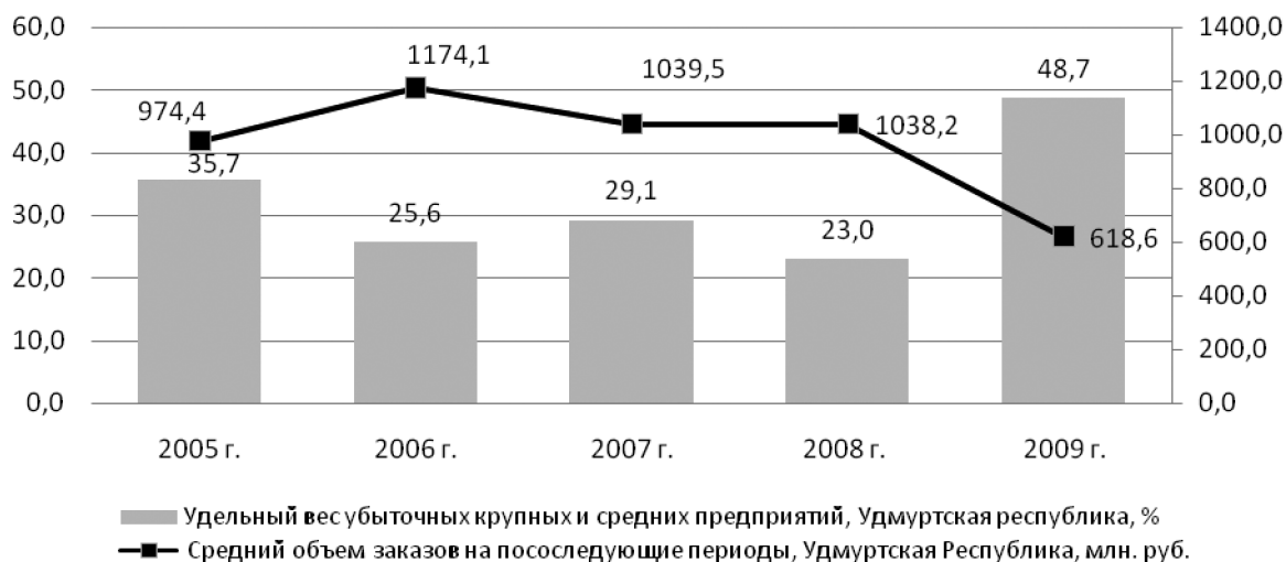
Рис. 2. Финансовое состояние крупных и средних машиностроительных предприятий Удмуртии (составлено автором по данным Росстата [5])

Одним из основных показателей, свидетельствующих о наличии кризисных явлений на предприятии, является убыточность его деятельности, которая может являться характеристикой любой стадии кризиса в экономике промышленного предприятия: кризис результатов, или оперативный кризис; кризис ликвидности; неплатежеспособность и банкротство. Конкретная фаза зависит от множества факторов, особенностей отрасли и состояния предприятия до начала мирового финансового и промышленного кризиса (рис. 2).