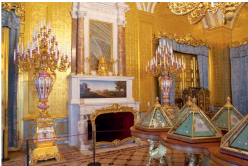
^ Камин в Эрмитаже