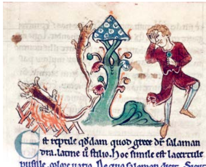
^ Огненная Саламандра. Средневековая миниатюра. Алхимический трактат