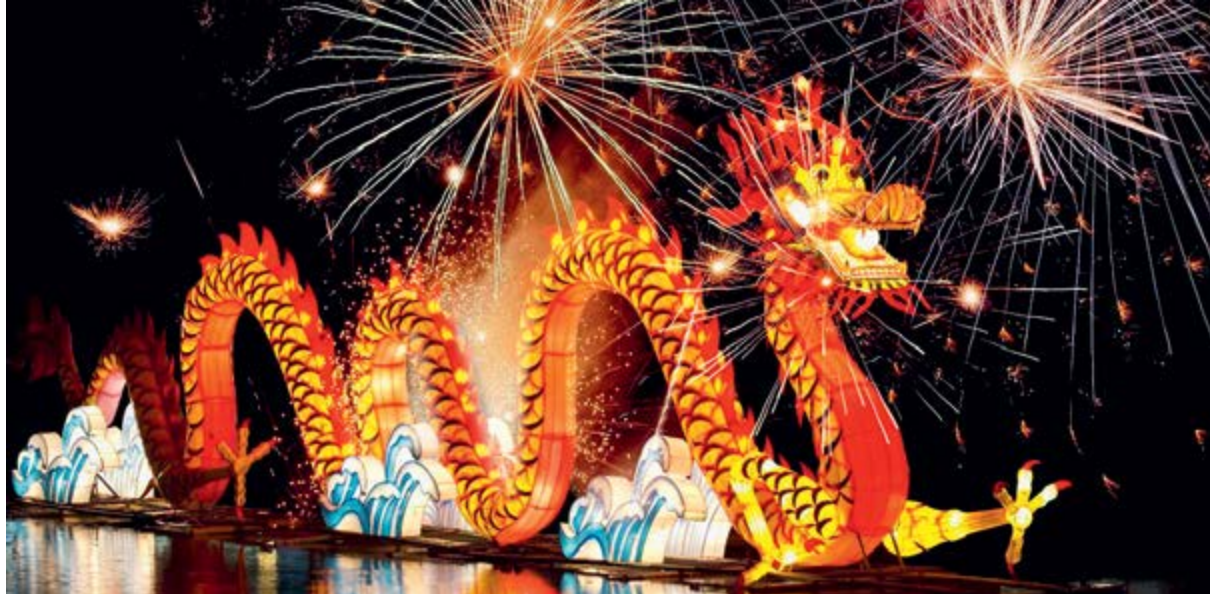
> Огненное шоу в Китае

(женское начало – инь) и горячей серы (мужское начало – ян) может помочь найти путь к просветлению и бессмертию.