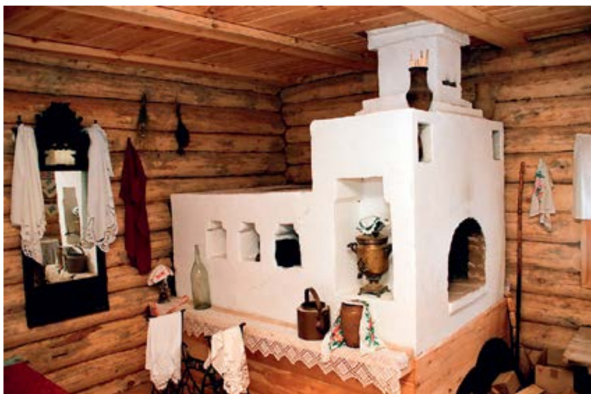
^ Русская печь

Менялись эпохи, менялись стилевые предпочтения, менялись и конструкции каминов. В XVIII веке американский изобретатель граф Румфорд изобрел камин с высокой и узкой камерой, обеспечивающей лучшую отдачу тепла. Обтекаемая форма горловины камина позволила холодному воздуху направлять в дымоход продукты сгорания. Это дало возможность встраивать камин внутрь стен, а не пристраивать к ним [13]. (Такие камины внутри стены проектировали впоследствии Фрэнк Ллойд Райт и Людвиг Мис ван дер Роэ.)