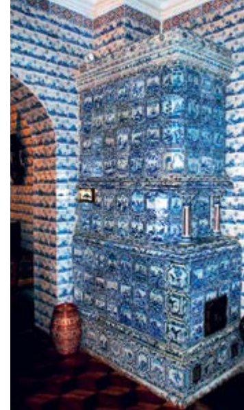
^ Печь в Меншиковом дворце

из специальных фасонных кирпичей с орнаментальной отделкой. Дымоходы могли быть различной формы в соответствии с модными стилями. Например, их строили в виде античных саркофагов с архитектурными элементами – пилястрами, колоннами, маскаронами, профилями. Порталы каминов изготавливали из мрамора и гранита, отделывали декором, мозаикой, резными украшениями над каминными досками.