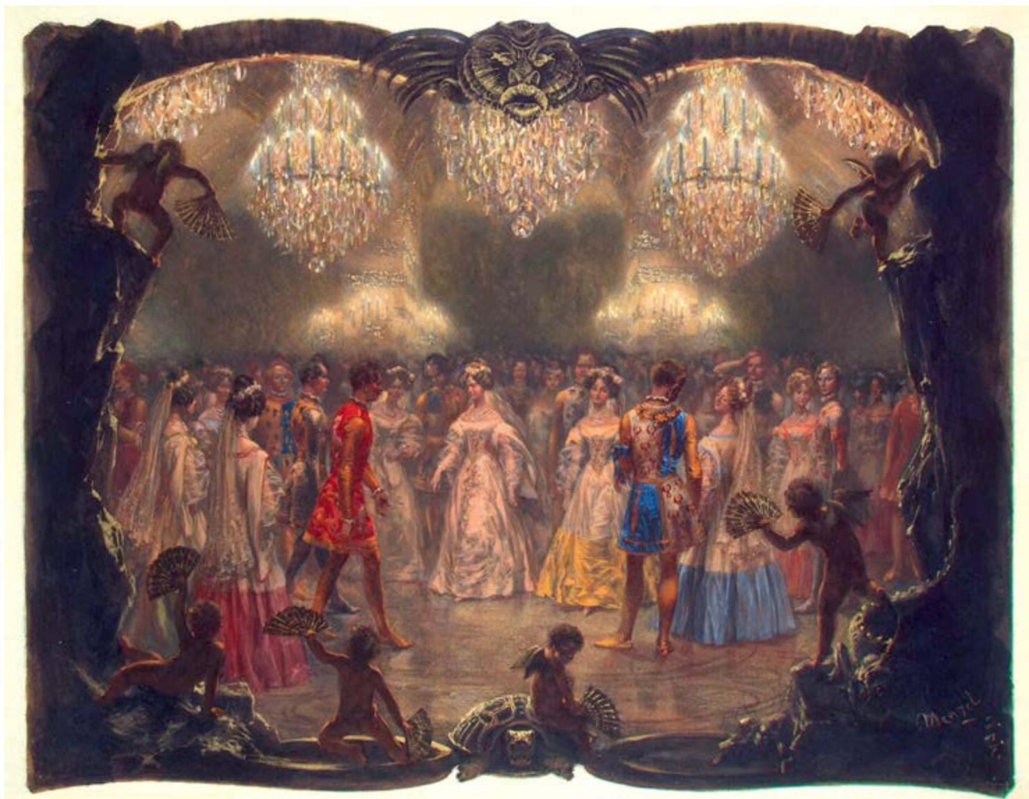
v Адольф Менцель. Бал при дворе

Напрасно Анна Ярославна просила французов соорудить печь в замке. В XI веке понять ее вряд ли могли. В это время на Руси наиболее распространенным типом была большая глинобитная печь без трубы, хотя встречались и печи с трубами. Только в XVI – XVII веках в Москве