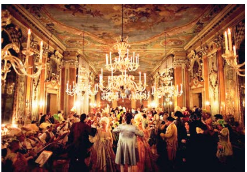
^ Бал при свечах. Начало XIX века

– восковые. К началу XIX века сальная свеча стоила 12 копеек, а восковая – 50. Для сравнения: фунт осетрины в 1804 году стоил 13 копеек. В 1830-е годы появляются недорогие парафиновые свечи, но они считались неэстетичными – были мягкие и грязно-серого цвета. В 1825 году изобрели стеариновые. Парафиновая свеча стоила дешевле стеариновой. С развитием китобойной промышленности в конце XVIII века произошел настоящий прорыв в изготовлении свечей. Их стали делать из спермацетового воска, получаемого из спермацетового масла, которое находится в жировой подушке на лбу у кашалота. Как и пчелиный воск, спермацетовый горел без вони, но свечи из него были дорогими. В Россию их привозили из Франции. «Не будучи еще зажжены, украшают уже чрезвычайно своею белизною и прозрачностью», – писали в рекламе [8].