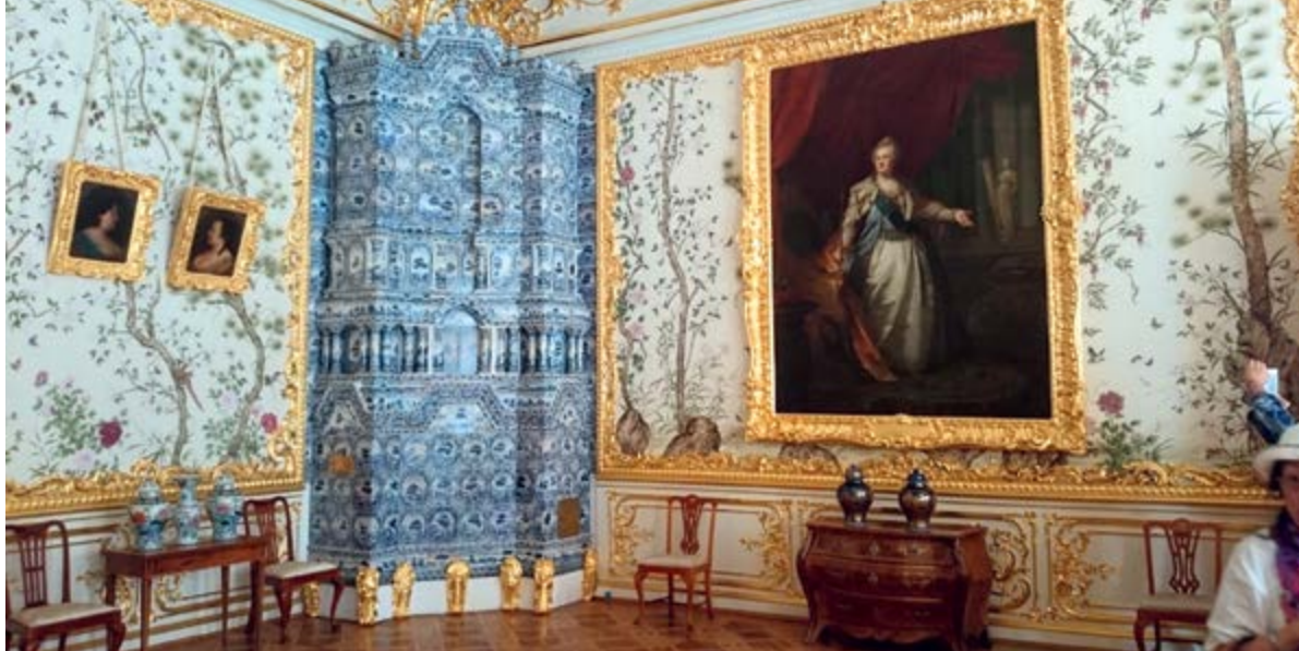
^ Печь в Екатерининском дворце