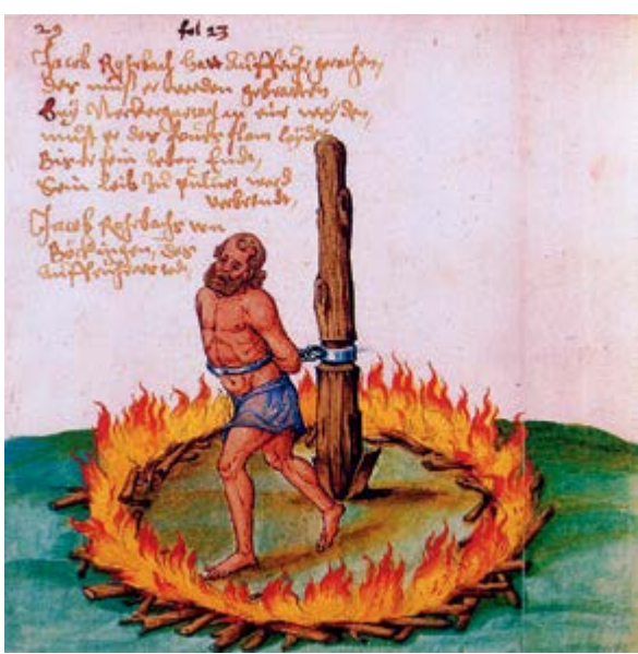
^ Аутодафе. Средневековая миниатюра