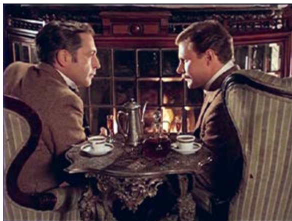
> Шерлок Холмс и доктор Ватсон у камина. Кадр из кинофильма «Приключения Шерлока Холмса и доктора Ватсона», в главных ролях Василий Ливанов и Виталий Соломин

Вариантов поддерживать комфортную температуру в помещениях великое множество. Печь в доме – вещь скорее утилитарная, хотя... Но камин... Come in, присаживайтесь в английское кресло, прикройте ноги пледом и забудьте обо всем, глядя на пляшущие язычки пламени.