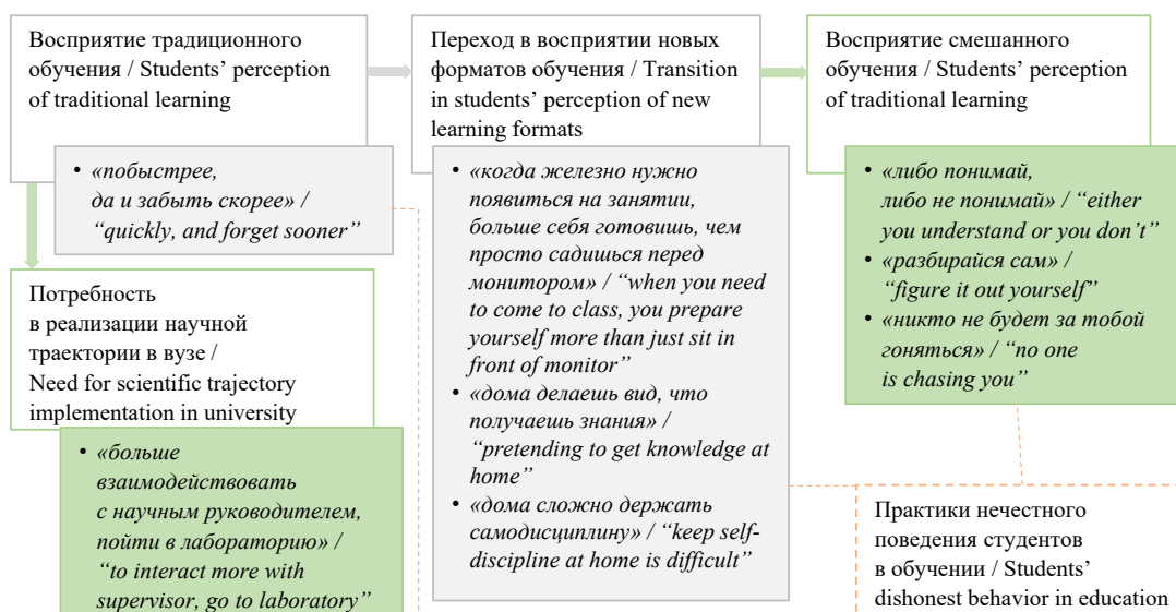
Р и с. 2. Восприятие студентами необходимой активности личности для освоения образовательного процесса высшего образования в разрезе форматов обучения 11