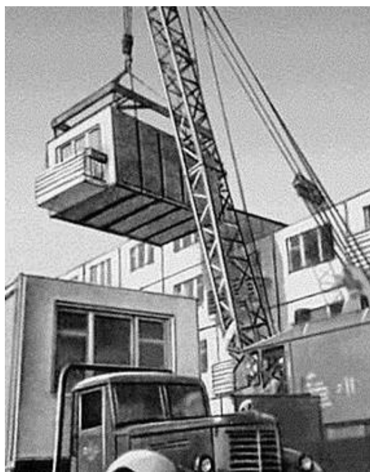
Рис. 5. Монтаж блок-комнаты