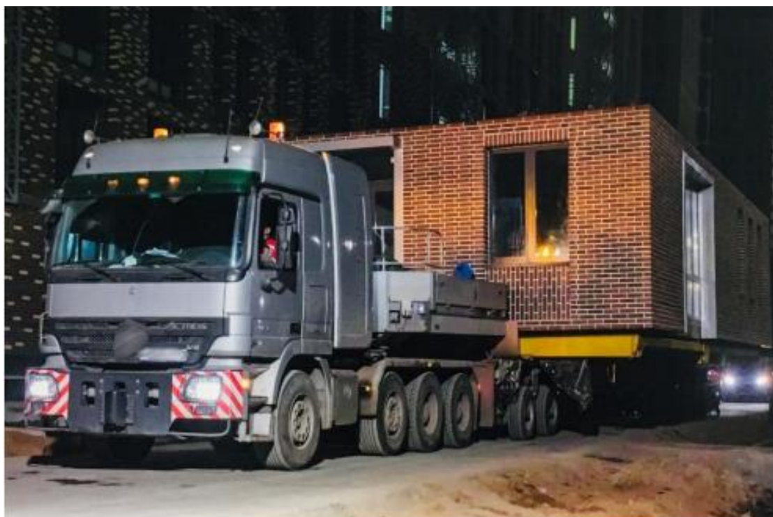
Рис. 2. Пример транспортирования модуля