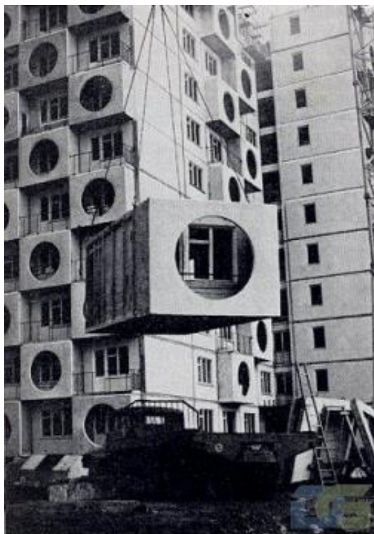
Рис. 4. Монтаж «с колес» 12-этажного жилого дома из объемных блоков на 96 квартир серии БРК-9 в городе Николаеве