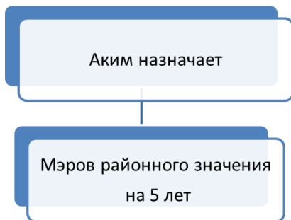
Схема 2. Назначение мэров районного значения

Мэров районного значения назначают акимы соответствующего района.