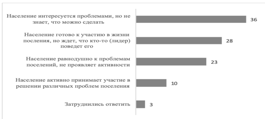
Рис. 1. Распределение ответов респондентов на вопрос: «Как Вы можете оценить социальную активность населения в решении проблем поселения?», в %

По данным опроса практически четверть опрошенных граждан (23%) равнодушна к проблемам поселений, не проявляет активности. Больше половины опрошенных респондентов (64%) готовы к участию в жизни поселения, интересуются общественными проблемами, но либо не знают, что можно предпринять для их решения, либо ждут инициативы от органов власти или более активных граждан, лидеров. И лишь 10% респондентов считают, что население активно принимает участие в решении различных социально-экономических, культурных, политических проблем своего поселения (рис. 1).