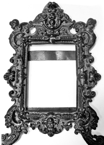
Рис. 1. Чугунная рамка для фотографий с растительным орнаментом и ангелочками. Изделие Воткинского железодельного казенного завода.