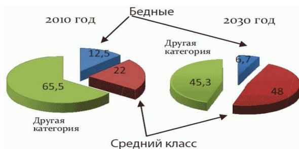
Рисунок 2 – Структура населения России 2010-2030г.

Практическое применение демонстрирует "Прогноз долгосрочного социально-экономического развития РФ до 2030г" Минэкономразвития, в котором население разделяется на основе экономических критериев стратификации.