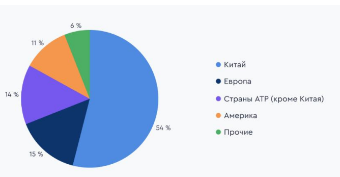
Рисунок 2 – Потребление рафинированной меди по регионам мира.

Стоит отметить, что крупнейшими производителями меди в России является «Уральская горно-металлургическая компания» (УГМК) и «Русская медная компания» (РМК). Что касается РМК, то данная компания не ведет прямые поставки в США, скорее всего это происходит через международных трейдеров. США вряд ли является крупным рынком сбыта для РМК из-за своей удаленности. Для данной компании интерес больше представляют рынки в Китае и Европе [3]. Интересно, что в санкционный список попал глава компании РМК Игорь Алтушкин. Производство Меди является подотраслью цветной металлургии. По данным Евростата российские поставки цветных металлов занимают 22% от общей отрасли импорта стали в Евросоюз. Европа и США являются крупным потребителем меди [2].