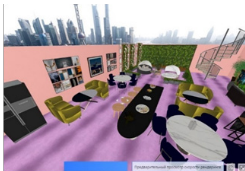
Рис. 2. Вторая зона

Общим элементом экодизайна для двух зон являются растения, а остальные элементы отличаются. Так, в первой зоне еще есть декоративная стена-водопад, а также участок пола под имитацию травы (рис. 1).