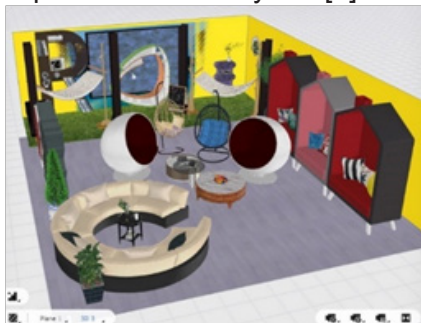
Рис. 1. Первая зона

так и студентов, которые будут содержать удобную мебель, элементы экодизайна и в то же время послужат уютными пространствами, куда можно будет прийти в перерывы, одновременно поработать и в то же время отдохнуть, но уже в менее формальной обстановке. Зоны были спроектированы при помощи программы «Homestyler» [1].