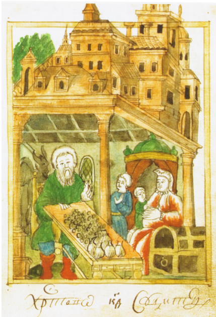
1. Дьявол поучает роскошника. Миниатюра Синодика Сольбинской Никольской пустыни. Л. 16

Liudmila Sukina. The Condemnation of Avarice as "Demonic Instigation" in the Illustrations of Synodics of the Early Modern Period