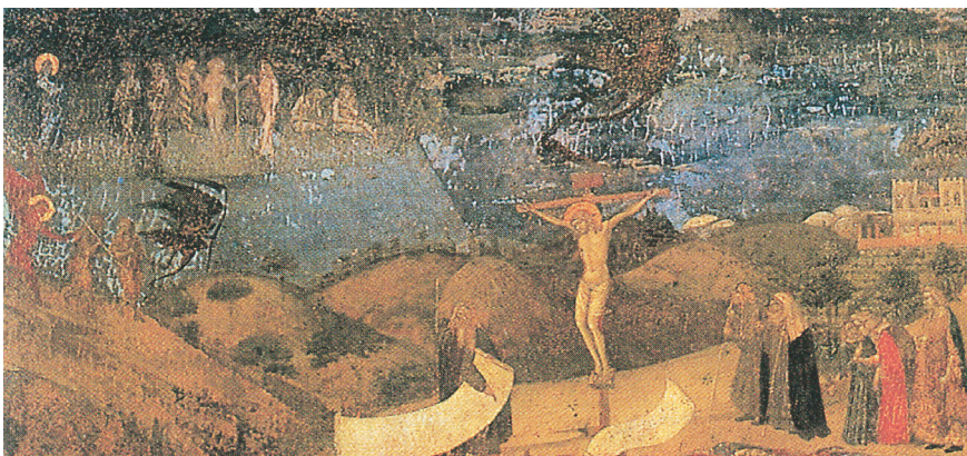
4. Амброджо Лоренцетти. Аллегория искупления человечества. Ок. 1330. Сиена, Пинакотекa. Фрагмент [Scaramella, p. 36] Ambrogio Lorenzetti. Allegory of the Redemption. C. 1330. Siena, Pinacoteca. Fragment