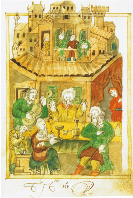
2. Пир в доме роскошника. Миниатюра Синодика Сольбинской Никольской пустыни. Л. 17

The devil teaches a spendthrift. Miniature of the Synodic of St Nicholas Monastery of Solba. P. 16