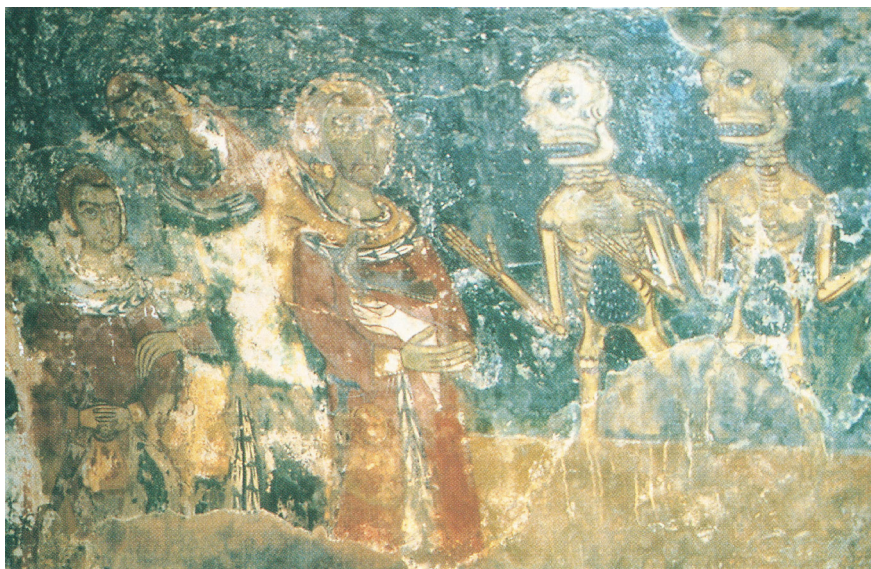
1. Встреча живых и мертвых. 1258–1266. Мелфи, церковь Святой Маргариты [Scaramella, p. 26]

Illustration for the article: Irina Dergacheva. The Triumph of Death of the Danse Macabre and the “Eschatological Optimism” of the Synodics