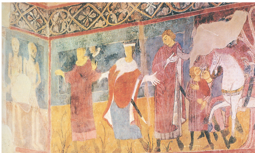
2. Встреча живых и мертвых. 1258–1266. Атри, собор [Scaramella, p. 27]

Meeting of the Living and the Dead. 1258–1266. Melfi, Church of St Margaret