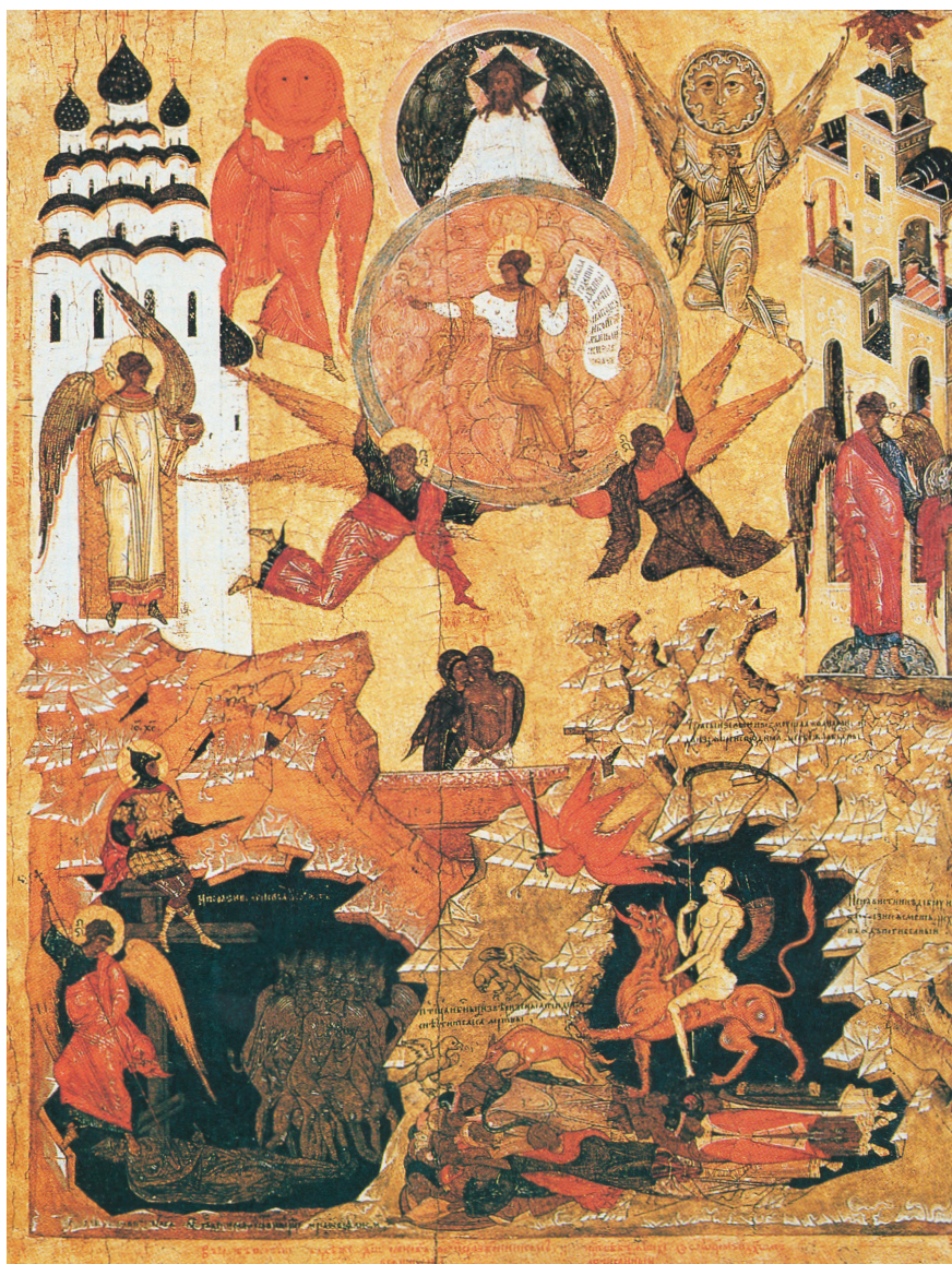
6. Сыне едиnorodный. Четырехчастная икона. 1547 г. Москва, Музей Кремля [Vilimbachova, p. 257]

The only begotten son. Four-part icon. 1547. Moscow, Kremlin Museum