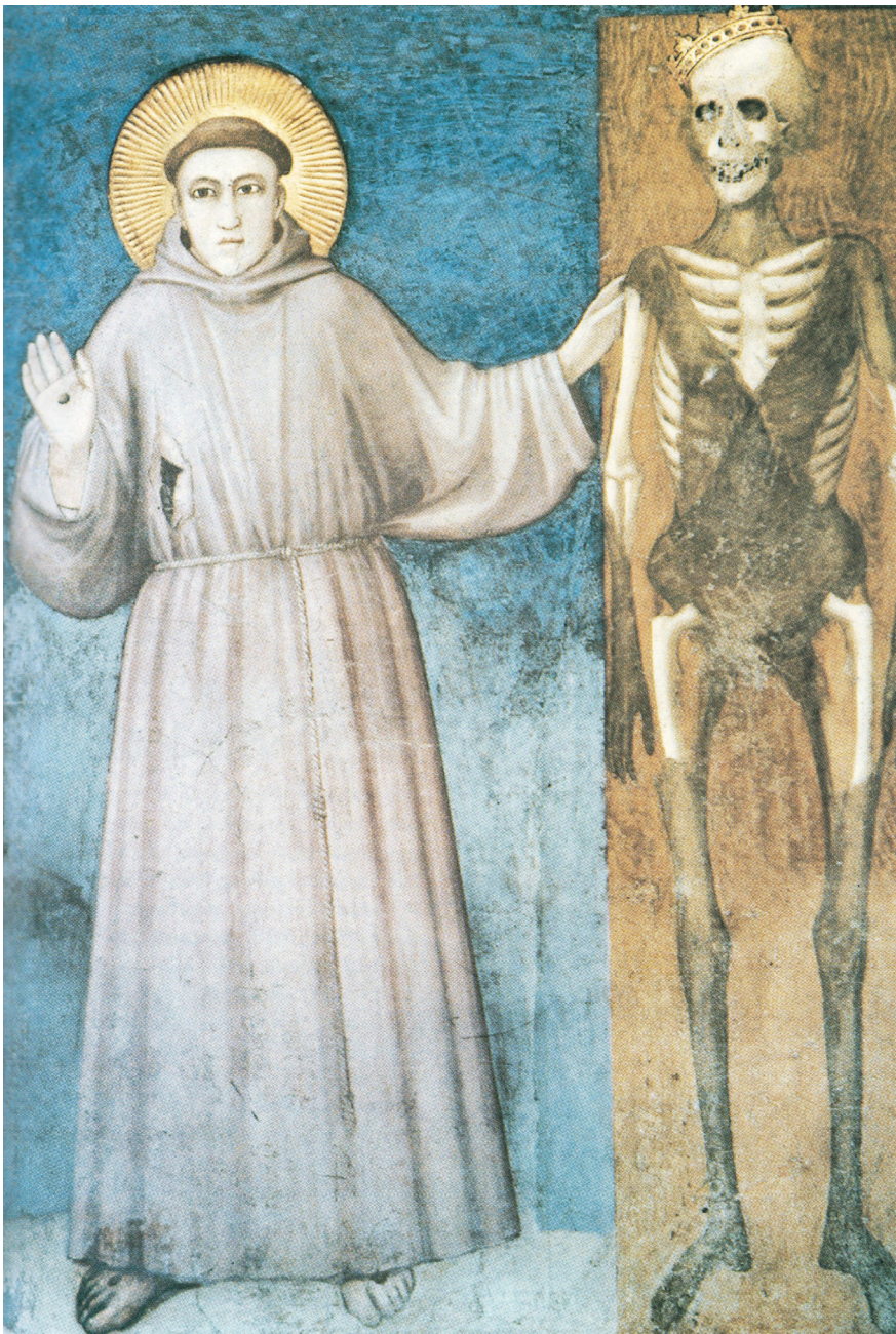
3. Св. Франциск представляет «sora nostra morte corporale» («сестру нашу, смерть тела»). Середина XIV в. Ассизи, нижняя церковь Св. Франциска [Scaramella, p. 36]

St Francis presents “sora nostra morte corporale” (“our sister death of the body”). Mid-14 th century, Assisi, lower church of St Francis