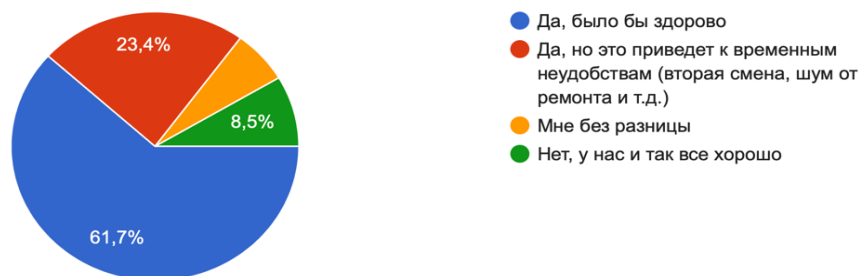
Рисунок 2 – Мнение участников опроса о получении инвестиций

4. Какие критерии экологического характера ESG Вы готовы соблюдать на территории СУНЦ? (можно выбрать несколько вариантов)