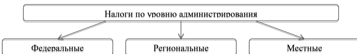
Рисунок 10 – Классификация налогов по уровню администрирования

Важным вопросом, которому следует уделить внимание, представляется классификация налогов по уровню администрирования, которая представлена на рисунке 1.