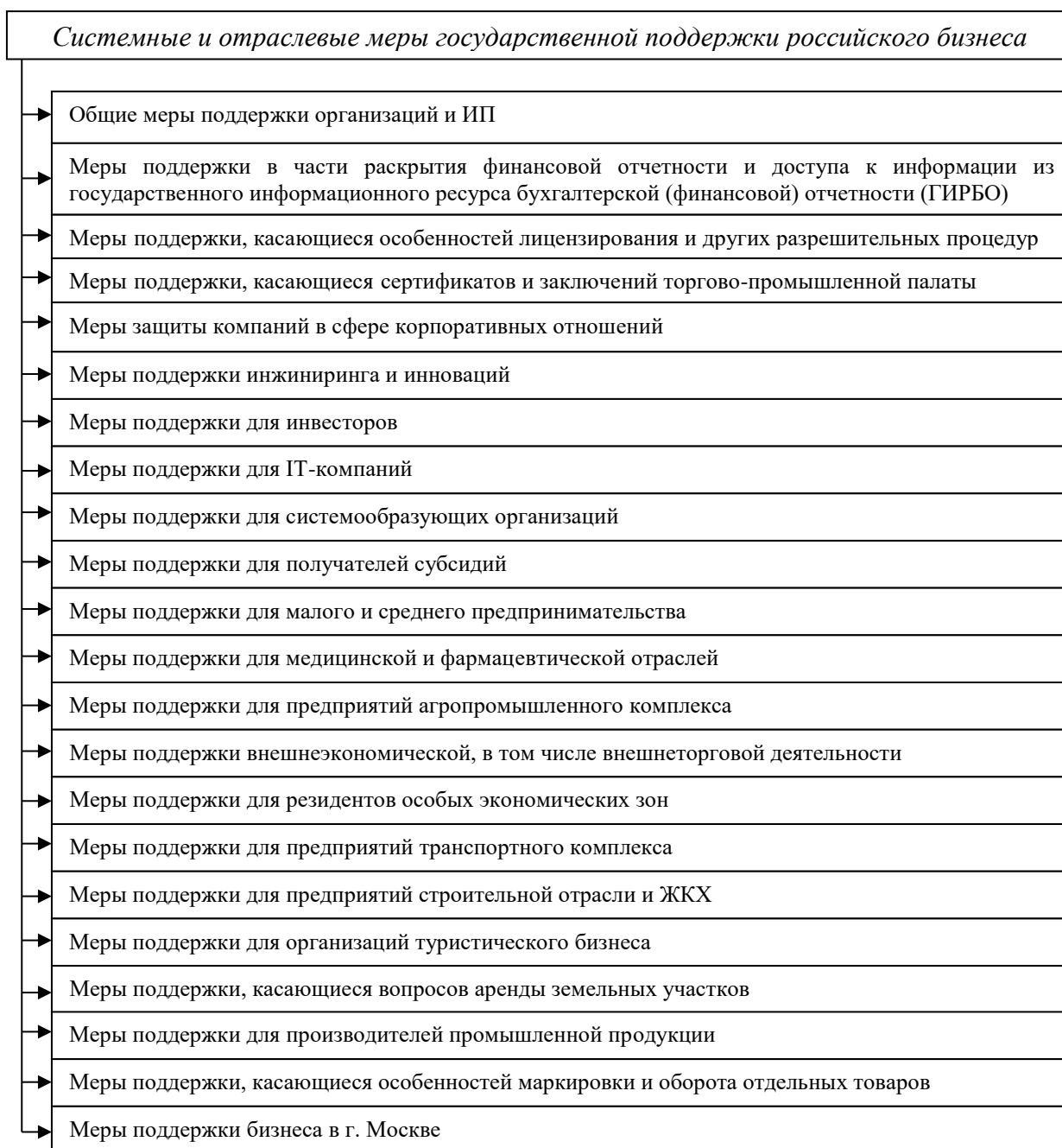
Рисунок 1 – Состав системных и отраслевых мер государственной поддержки российского бизнеса, предложенных Правительством РФ в марте 2022 г.

Состав первого блока мероприятий представлен на рисунке 1.