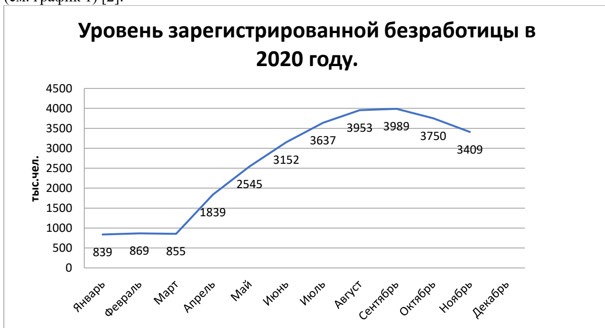
График 4 – Рост безработицы в связи с эпидемией коронавируса

По причине безработицы, которая сопровождалась потерей дохода и снижением покупательной способности, можно также наблюдать дестабилизацию экономики, которая в длительном периоде приведет к снижению квалификации работников. В период с 2006 по 2017 гг. средний показатель уровня безработицы постепенно понижался. Он уменьшился с 5250 тыс. чел. до 3929 тыс. чел. Но эти показатели резко изменились после локдауна и перевод работников на онлайн-формат. Средний уровень регистрируемой безработицы на 2020 год по подсчетам составил 3.2%, а это почти что в три раза больше, чем в предыдущем году. Самый же пик пришелся на сентябрь 2020, когда уровень безработных достиг 4,9% (см. график 1) [2].