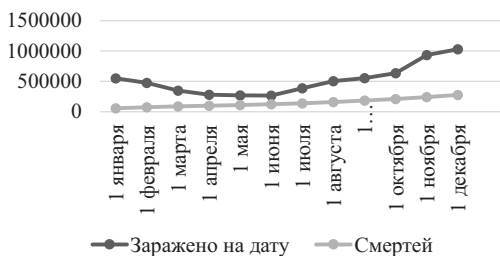
Рис. 1. Динамика распространения коронавируса в России на 2021 год

На основании приведённого графика мы видим то, что, начиная с июня и до декабря включительно наблюдается постоянный рост заболеваемости, а также постепенное увеличение смертности. Соответственно, ситуация по стране не улучшается, несмотря на это в летний период времени, агитационная программа по вакцинированию и активному противодействию коронавирусу была приостановлена, а список стран, разрешенных для посещения российскими туристами, не сокращался [7]. Следовательно, после достаточно свободного периода отпусков осенью начинается резкий скачок заболеваемости во всех регионах страны, что стимулирует правительство предпринимать незамедлительные меры по противодействию коронавирусу, а значит вводить новые ограничения и применять различные стратегии. Одним из таких мер, является предложение Президента РФ о введении нерабочих дней в октябре-ноябре 2021 года [13], при этом каждый регион имеет право реализовать это так, как считает нужным.