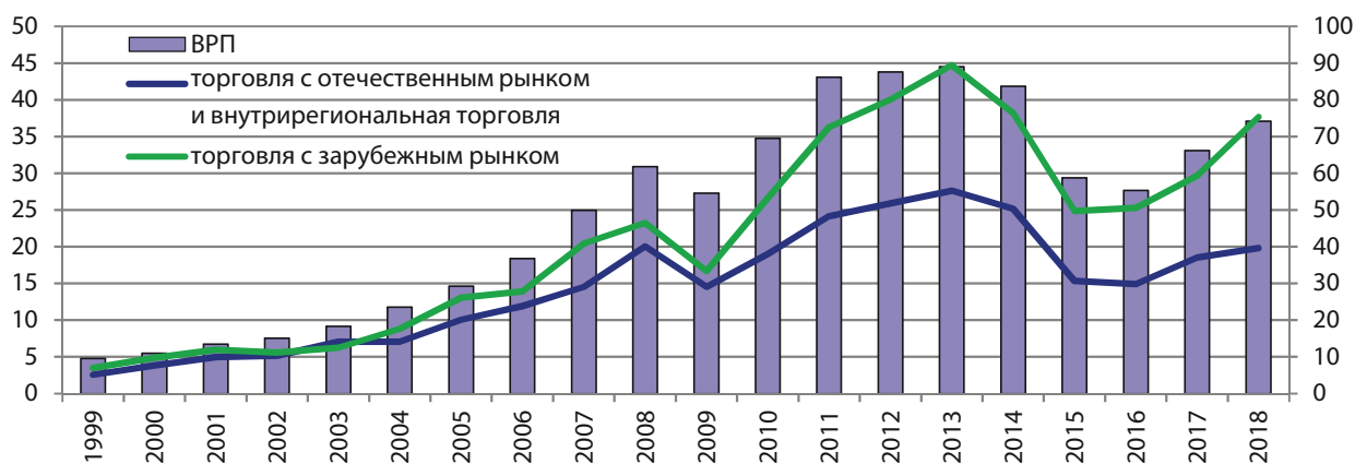
Рис. 1. Внешние и внутренние торговые потоки регионов Дальнего Востока (левая ось) и ВРП макрорегиона (правая ось), млрд долл. (источник: статистические данные Федеральной таможенной службы, Госкомстата, статистических комитетов регионов и отраслей).