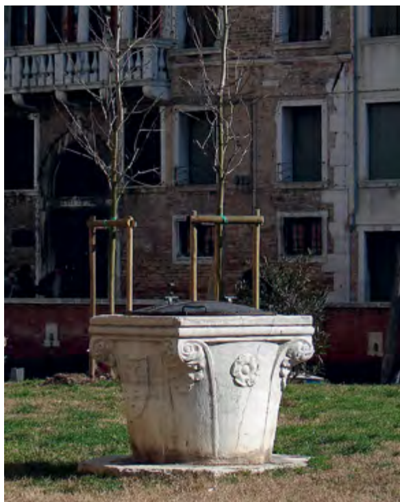
v > Рис. 5–8. Венецианский колодец

культурах. Глубокие рукотворные колодцы всегда воспринимались порталами, связывающими разные миры, а потому они мыслились и предельно опасными, и целебными. Языческие магические обряды и ритуалы, связанные с колодцами, очень распространены. Христианская церковь всегда с ними боролась. Но нередко на рассвете в определенные дни у колодцев можно и сегодня встретить девиц, которые пытаются в темной глубине увидеть суженого. Иногда безутешные родственники умершего вглядываются в темное зеркало колодезной воды, надеясь увидеть его смутную тень [7]. Немцы говорят: «Если ты долго смотришь в бездну, то бездна тоже смотрит в тебя» (Wer mit Ungeheuern k mpft, mag zusehn, dass er nicht dabei zum Ungeheuer wird). Верили, что из бездны в дольний мир могут прийти через колодец незванные гости.