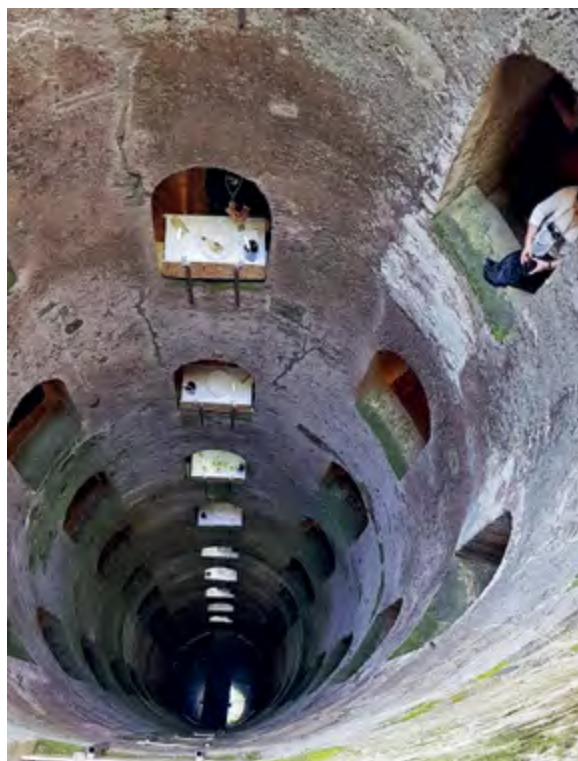
< Рис. 9. Колодец Святого Патрика в Орвието. Архитектор Антонио да Сангалло-мл. 1527–1537