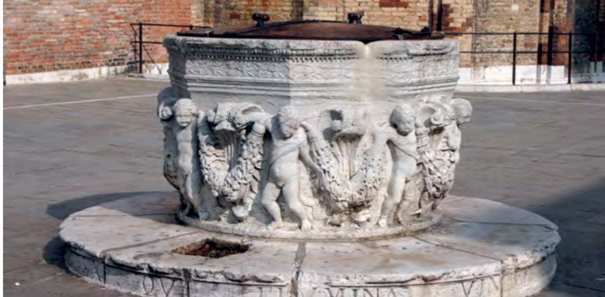
> Рис. 4. Венецианский колодец