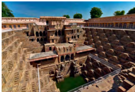
< ^ Рис. 10-11. Колодец в Чанд Бари. Индия. IX–XV вв.

Чаще всего часовни над колодцами небольшие. Но иногда это грандиозные сооружения. Например, на площади Польский рынок в украинском городе Каменец-Подольский, кроме городской ратуши, есть и еще одна уникальная достопримечательность – Армянский колодец. Часовня над колодцем представляет собой восьмиугольную в плане башню, в которой находится прорубленная в сплошной скале шахта диаметром 5 и глубиной свыше 30 м. Высота здания над колодцем – 14 м. Башня-часовня построена над колодцем по проекту инженера и архитектора Яна де Витте, когда он был комендантом польской крепости в Каменце-Подольском с 1768 по 1785 год. Ян де Витте знаменит как автор Доминиканского костела во Львове (1749). Его внук Иван Осипович де Витте – генерал от кавалерии, герой войны 1812 года. Его портрет кисти Джорджа Доу находится в Военной галерее Зимнего дворца в Петербурге. Армянский колодец еще называют «памятником коррупции»: богатый армянский купец Нарзес в XVII в. выделил деньги на строительство городского водопровода, но средства исчезли. В наказание по приказу короля армянской общине Каменца-Подольского (1200 семей) пришлось