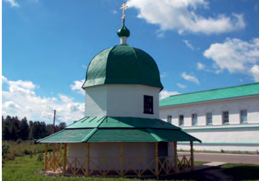
> Рис. 3. Свято-Троицкий Александро-Свирский монастырь. Часовня над колодцем, вырытым Александром Свирским. Дер. Старая Слобода Лодейнопольского района Ленинградской области. 1791

воды от 10 до 600 литров на человека в сутки [2]. Историки утверждают, что и в императорском Риме потребление воды было сопоставимым: термы, фонтаны, бассейны, навмахии [16].