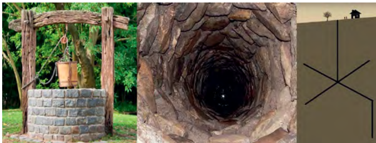
< Рис. 13. Схема колодца в Вудингдине (Англия)

и форма фонтана будет чем-то напоминать о старом колодце. Возможно, будет и питьевой фонтанчик, если вода будет пригодна для питья. В общем, есть о чем подумать и скульпторам, и архитекторам, и санитарным врачам.