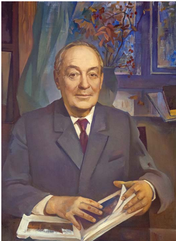
Академик Исаак Яковлевич Постовский

Художник А. В. Юркин (?), конец 1980-х гг. Уральский федеральный университет