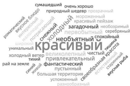
Диаграмма частотности слов подтверждает, что студенты положительно оценили культурное и природное наследие Сибири с помощью таких прилагательных: красивый , великолепный , привлекательный , своеобразный и т. д. Положительные свойства проявляются также в метафорических выражениях: природное наследие Сибири – шедевр ; Сибирь – это рай на земле . Таким образом, сложившееся в сознании китайских студентов представление о культурном и природном наследии Сибири носит позитивный оттенок.

Между тем анкетирование позволило нам выявить частотность слов, употребляемых студентами для характеристики культурного и природного наследия Сибири. См. диаграмму 3.