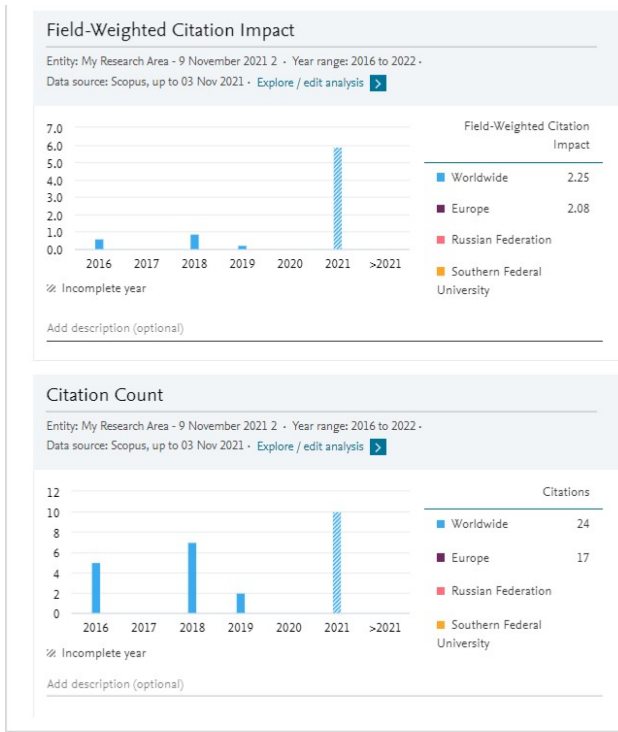
Рисунок 2. Показатели цитирования публикаций по топику «Региональная резилиентность, стратегия адаптации, экономический кризис, внешний шок» 2

Также стоит отметить, что в 2021 году на рассмотрении по данному топику находится 177 публикаций в различных журналах.