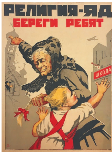
5. «Религия – яд, береги ребят!» Плакат Н. Терпсихорова. 1930 “Religion is a poison! Protect your children!” Poster by N. Terpsykhorov. 1930

Illustration for the article: Galina Egorova. Fear and Childhood Victimization in Atheistic Discourse during the Khrushchev Era