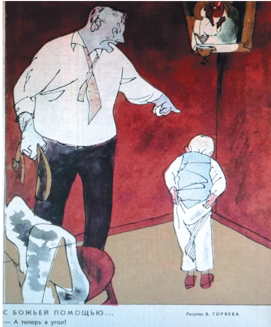
7. «С Божьей помощью». Рис. В. Горяева. Крокодил. 1964. № 8 “With God’s Help.” Ill. by V. Goryaev. Krokodil. 1964. No. 8