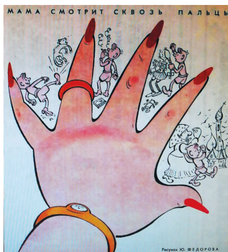
6. «Мама смотрит сквозь пальцы». Рис. Ю. Федорова. Крокодил. 1964. № 5 “Mother Turns a Blind Eye.” Ill. by Yu. Fedorov. Krokodil. 1964. No. 5