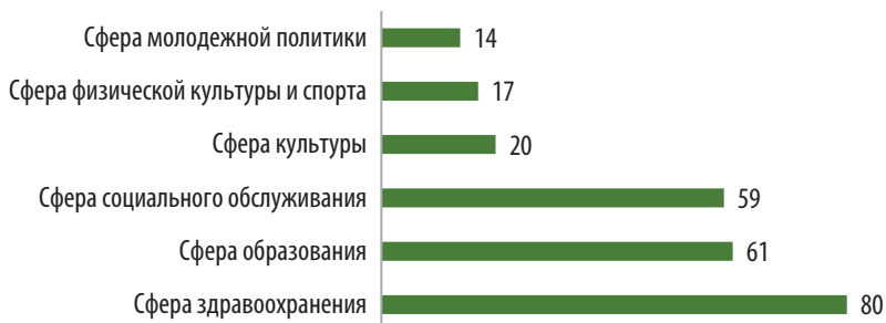
Рис. 1. Какие из нижеперечисленных сфер требуют улучшения, развития и увеличения перечня предоставляемых услуг больше всего?, в % (несколько вариантов ответов)

Более половины опрошенных (59 %) отмечают, что сфера социального обслуживания требует развития. По сравнению со сферой