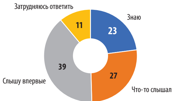
Рис. 2. Распределение ответов на вопрос «Знаете ли Вы, слышали, либо слышите сейчас впервые о социальном предпринимательстве?», в %

Можно выдвинуть предположение, что ответы респондентов связаны с отсутствием у них информации о социальном предпринимательстве. Это можно частично доказать тем, что после вопроса: Знаете ли Вы, слышали, либо слышите сейчас впервые о социальном предпринимательстве? — в анкете было дано определение и при-