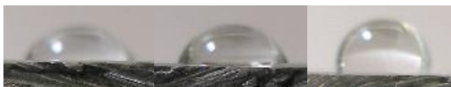
Рисунок 1. Топография и профиль сечения поверхности сплава АМг2М: (а) исходной и (б, в) модифицированной осаждением Мо в условиях ионного асситирования; (б) при U=3 кВ; (в) при U=15 кВ.

Средняя шероховатость исходного образца сплава АМг2М составляла 34,3 нм и снижалась при увеличении ускоряющего напряжения для асситирующих ионов Mo^+ до 7,8 нм при U=12 кВ и 9,9 нм при U=15 кВ. При внедрении сравнимых доз ионов молибдена в образцы сплава с увеличением ускоряющего напряжения значения РКУС также увеличиваются (Рис. 1).