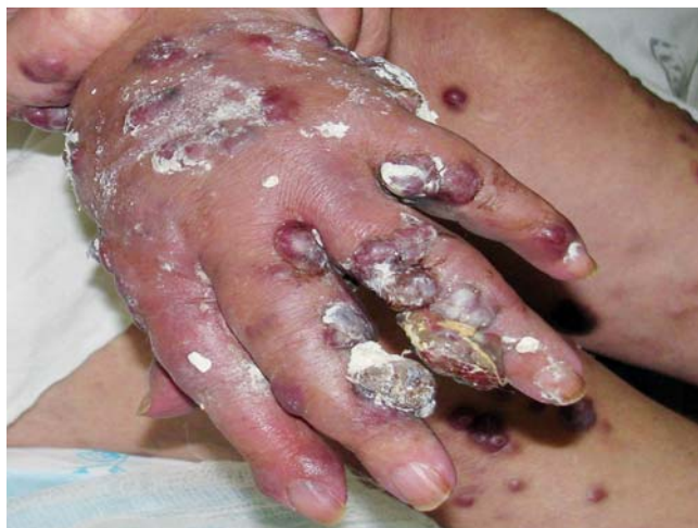
Abb. 1 Patientin, 74 Jahre alt, Diagnose: Kaposi-Sarkom, Tumorstadium. An der Haut der rechten Hand sind zahlreiche gruppierte Knoten mit einem Durchmesser von 1 bis zu 3 cm.