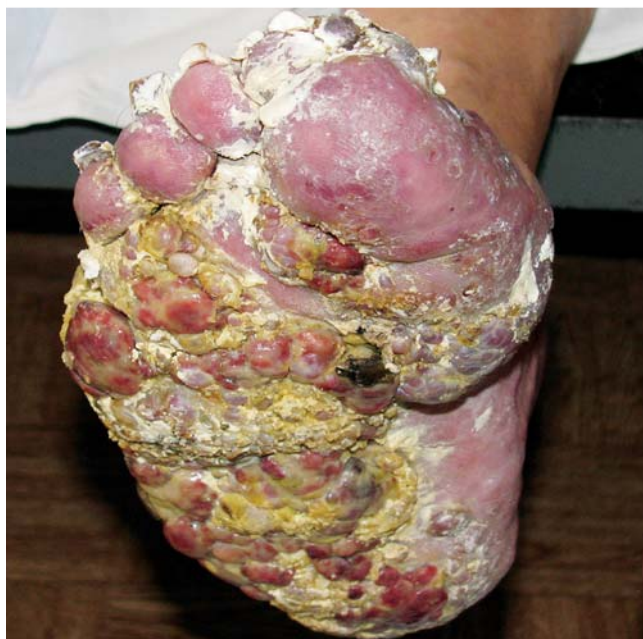
Abb. 2 Das Ödem und die Vergrößerung des linken Fußes, die Knoten haben eine feste Konsistenz und einen Durchmesser von 3 bis zu 5 cm.