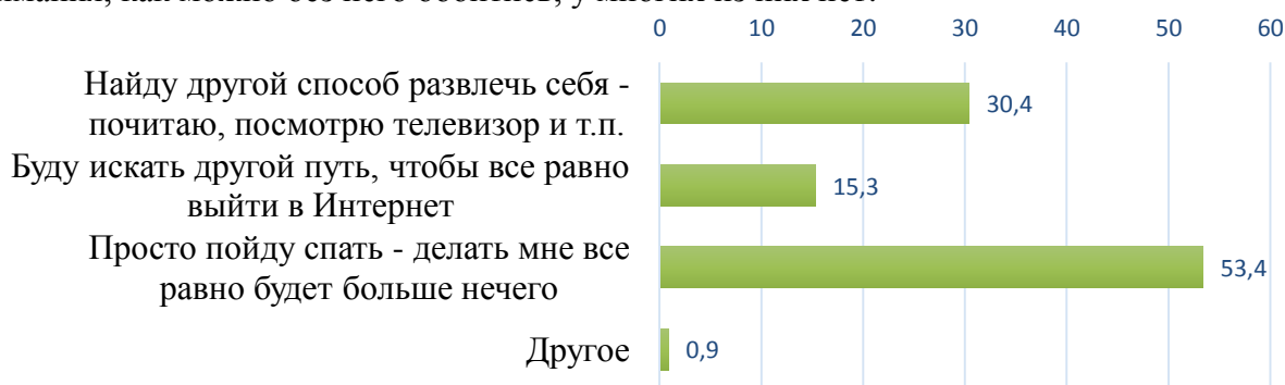
Рис. 1. Типическая реакция опрошенных на отсутствие Интернета в гостинице в другом городе (% от числа ответивших)

опрошенным проективный вопрос: «Что Вы будете делать, если приедете в гостиницу в другом городе и администратор сообщит Вам о том, что выйти в Интернет невозможно?». Те ответы, которые были получены нами на этот вопрос, показывают, что молодым людям сложно представить, как можно обойтись без Интернета в такой неприятной ситуации (рис. 1). Конечно, с нашей стороны было бы излишне категоричным сказать, что в распределении ответов прослеживаются симптомы массовой зависимости молодых людей от Интернета: все-таки видно, что лишь немногим более 15 % из них в подобной ситуации стали бы искать выход в Интернет любой ценой. Но здесь показательно другое: только треть опрошенных говорит о том, что в отсутствие Интернета сможет самостоятельно найти другой способ развлечения, остальные признают, что развлечь себя иным путем им будет сложно. Иначе говоря, как таковой зависимости от Интернета у большинства молодых людей нет, но он настолько плотно вплетен в привычный им порядок жизни, что внятного понимания, как можно без него обойтись, у многих из них нет.