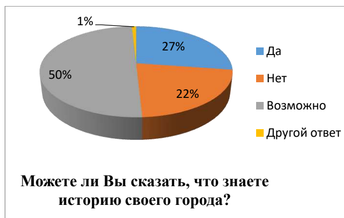
Рис. 2. Распределение ответов респондентов на вопрос на знание истории города Верхняя Салда

По мнению 62,6% респондентов Советское время оставило большее количество культурно-исторических объектов. Наибольший вклад в изучение истории своего города вложили посещение Верхнесалдинского краеведческого музея и школьная программа, это говорит, что основными источниками информированности людей являются социально-культурные институты.