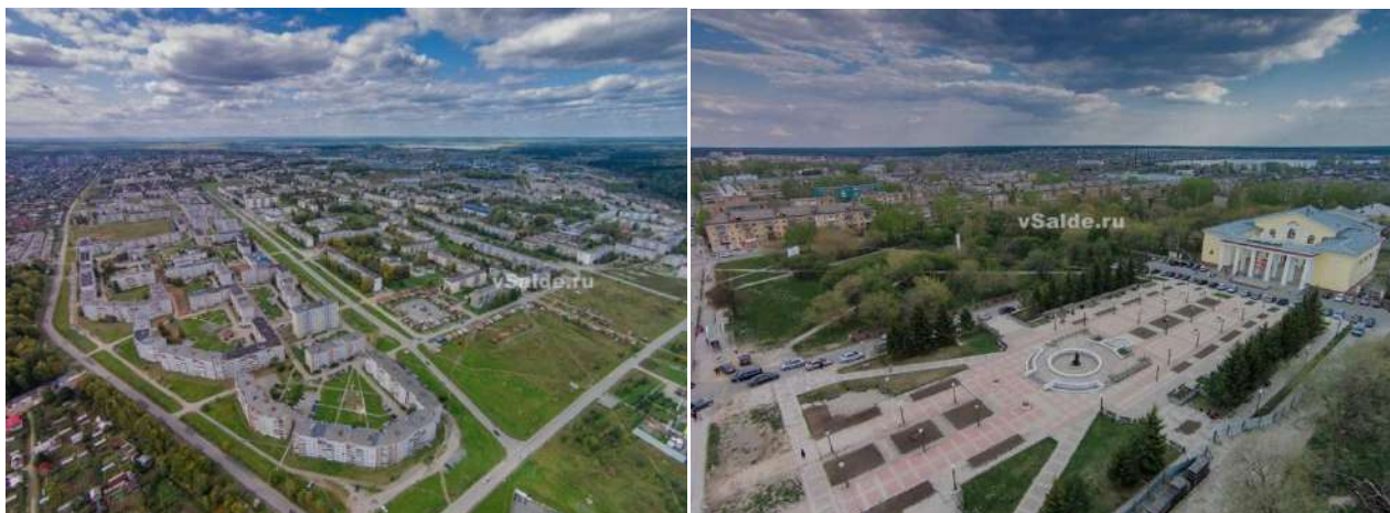
Рис. 1. а) Город Верхняя Салда; б) Дворцовая площадь, г. Верхняя Салда

В настоящее время в городе существует проблема сокращения численности населения, за последние десять лет, численность горожан снизилась на 6,2 тыс. человек и к 2017 году составила 42733 жителей. Данная проблема связана как с превышением смертности над рождаемостью, так и с оттоком трудового населения в крупные города. [10]