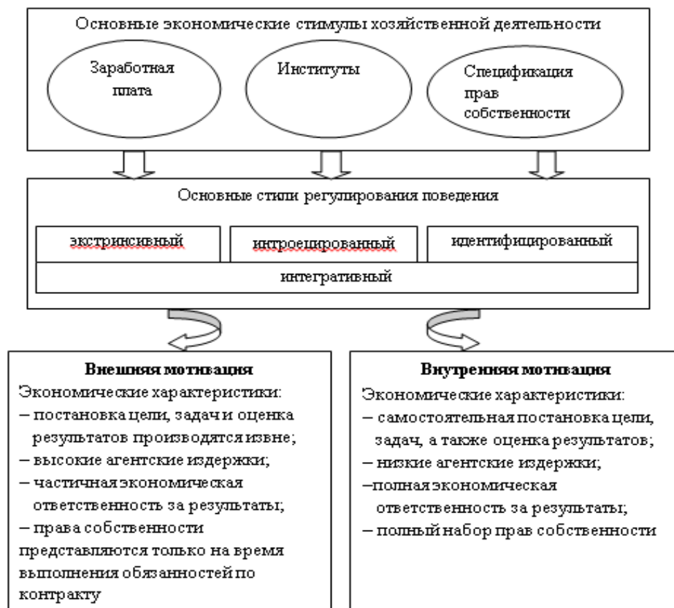
Рис. 2. Сравнительные характеристики внешней и внутренней мотивации экономической деятельности индивида