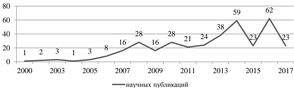
Рис. 1. Распределение количества публикаций по тематике исследования по годам (2002-2017)

ситуации также может свидетельствовать о научном интересе к данной области исследования.