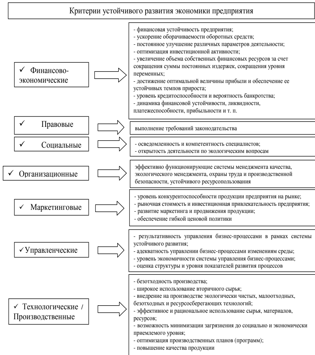
Рис. 2. Показатели экономической оценки устойчивого развития промышленного предприятия

правило, принимаются экономические показатели, характеризующие доходности компании [20, 21]. Обобщение полученных данных позволило сформировать набор экономических критериев устойчивого развития промышленного предприятия, схематично представленный на рис. 2.