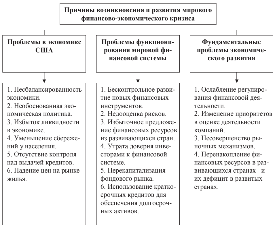
Рис.3. Причины возникновения и развития мирового кризиса

Таким образом, проведенный нами анализ существующих мнений позволил установить, что причины мирового финансового кризиса можно условно сгруппировать в три группы: проблемы в экономике США, проблемы функционирования мировой финансовой системы и фундаментальные проблемы экономического развития (рис.3). К первой группе можно отнести эмиссию правительством США огромных объемов денежной массы, не подкрепленную реальным производством, наращивание бюджетного дефи-