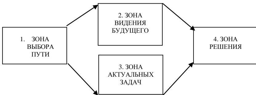
Рис. 2. Модель проведения сессии групповой фасилитации

На рисунке 1 показана наиболее распространенная схема инновационного процесса от зарождения идеи до реализации конечного продукта на рынке. Особое внимание в творческом подходе уделяется (1) стадии инновационного процесса, когда происходит генерация идей. На данный момент для генерирования идей существуют действенные методы, которые могут быть успешно внедрены в компаниях. Одним из прорывных направлений являются методы групповой фасилитации (рисунок 2), которые представляют собой комплекс творческих и логических приемов для совместного поиска идей и принятия решений, в обсуждение которых максимально вовлечен каждый из участников инновационного процесса [9].